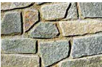
MISURE MISTE CON MOSAICO